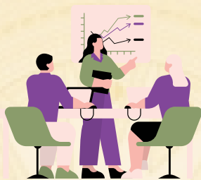
Hội đồng thành viên