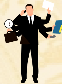
Chủ tịch công ty