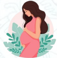
Phụ nữ có thai