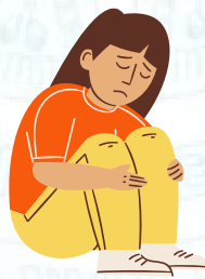
Trầm cảm, muốn/có hành vi tự sát