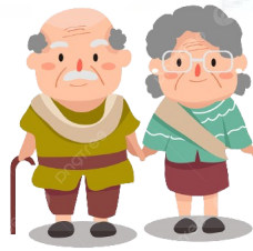
Người >= 75 tuổi