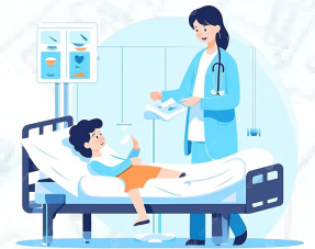
Trường hợp khác

Tâm thần, kích động, có khả năng gây hại cho mình/người khác/ phá hoại tài sản