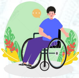
Người khuyết tật nặng, đặc biệt nặng