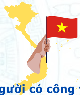
Người có công với cách mạng