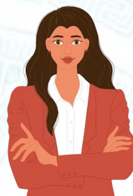
Doanh nhân, trí thức, nhà khoa học