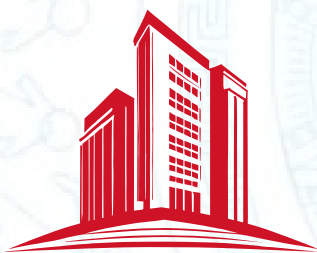
Doanh nghiệp, tổ chức kinh tế khác