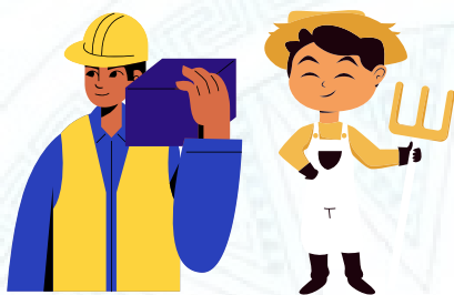
Công nhân, nông dân