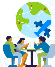
Cá nhân, tập thể người Việt Nam định cư ở nước ngoài, cá nhân, tập thể người nước ngoài.